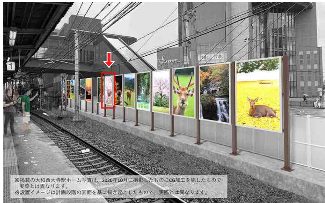
※掲載の大和西大寺駅ホーム写真は、2020年10月に撮影したものにCG加工を施したもので実際とは異なります。 ※設置イメージは計画段階の図面を基に描き起こしたもので、実際とは異なります。

1番線ホームの建植看板です。リニューアルされる看板ですので注目されやすい媒体です。 乗降人員 46,530人／日（乗り換え含まない） 先着順優先となりますのでお早めにお声かけ下さい。