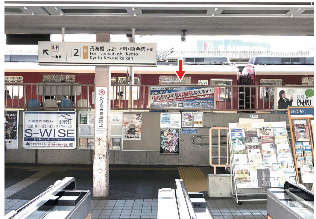
※写真は現状と異なる場合がございます

京都方面行き改札正面の額面看板です。 ホームへ向かう際に目の前を通られます。 乗降人員 16,232人/日 先着順優先となりますのでお早めにお声かけ下さい。