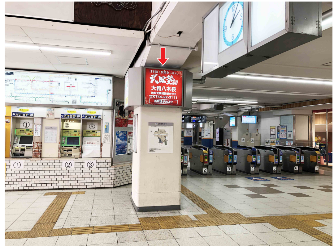
※写真は現状と異なる場合がございます