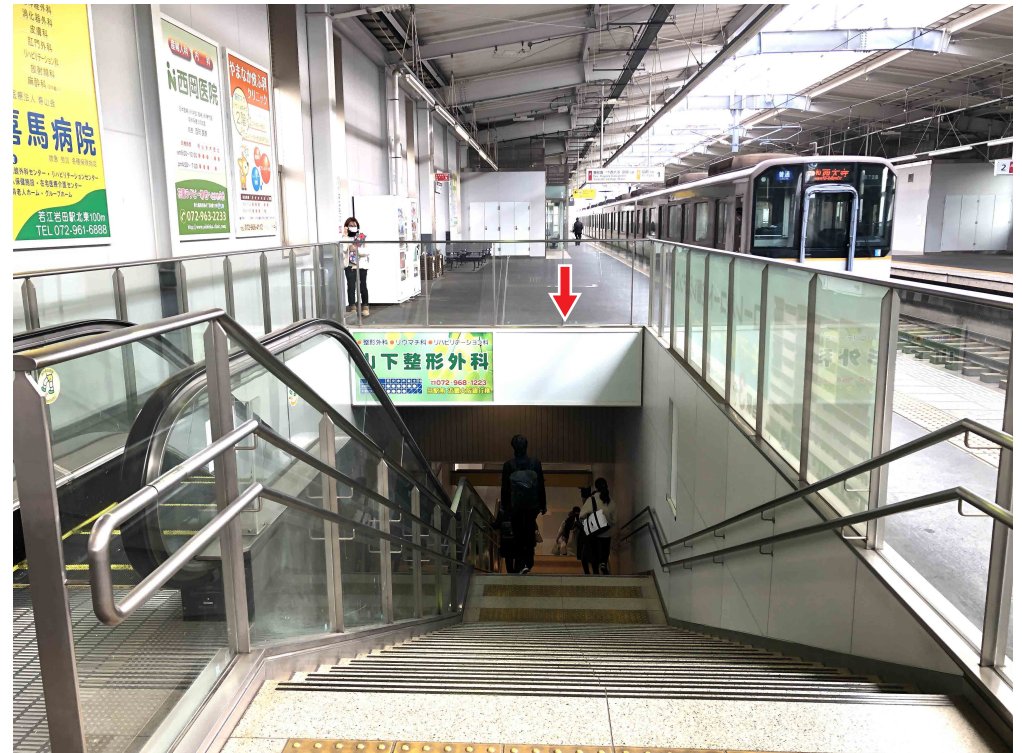
※写真は現状と異なる場合がございます