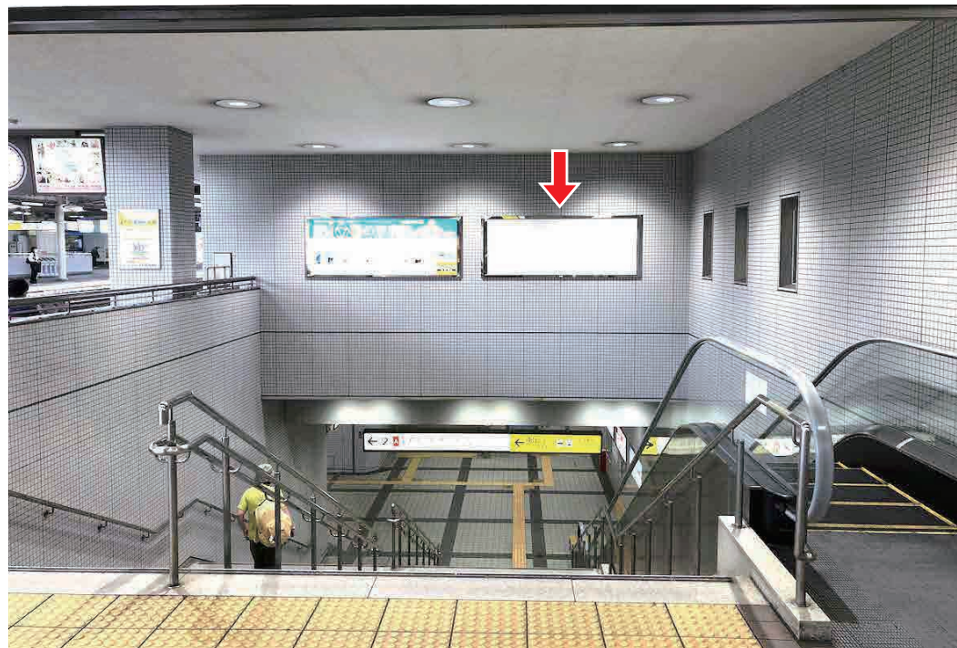
※写真は現状と異なる場合がございます