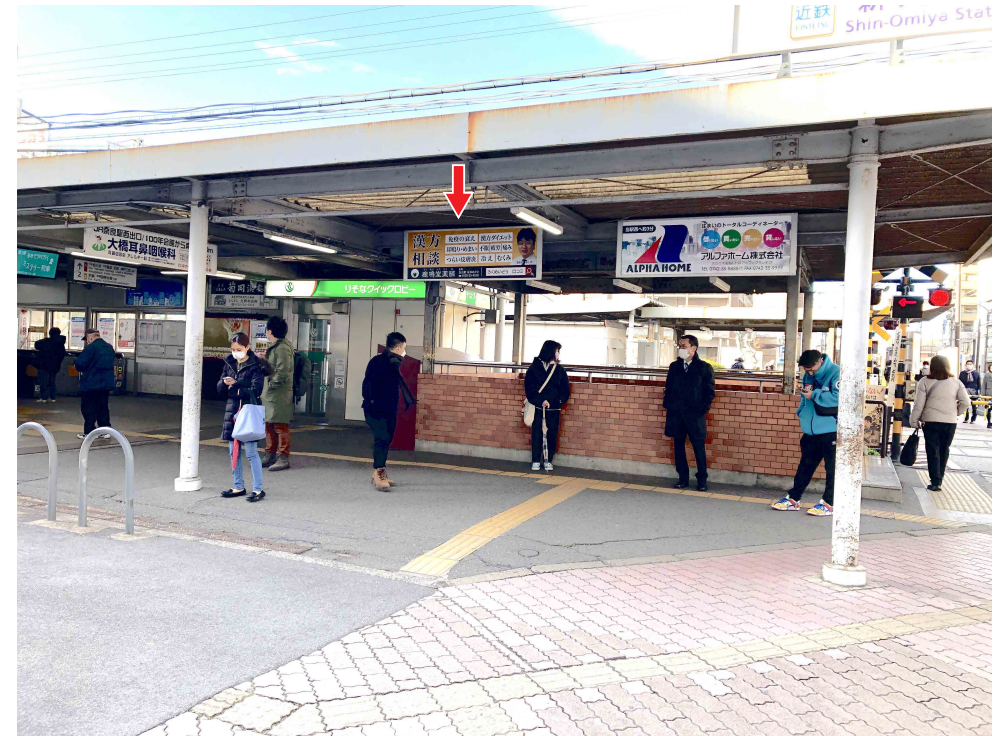
※写真は現状と異なる場合がございます

大和西大寺方面行き改札入り口の額面看板です。 横断歩道を渡って改札へ向かう際に正面に見えます。 乗降人員 28,670人/日 先着順優先となりますのでお早めにお声かけ下さい。