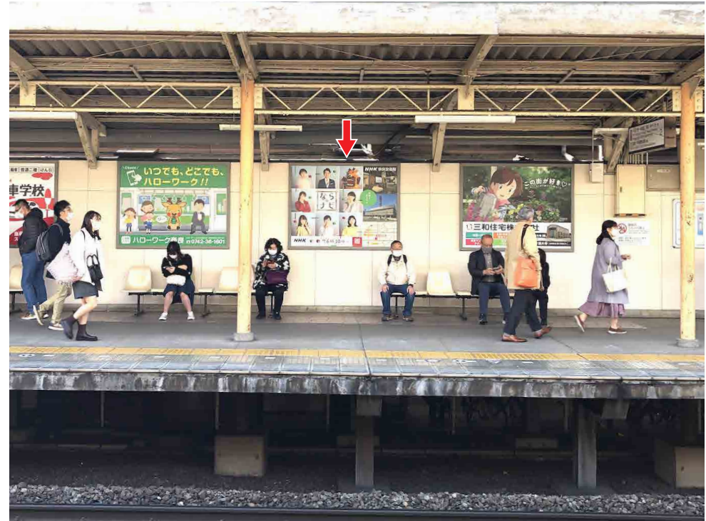
※写真は現状と異なる場合がございます

大和西大寺方面行きホームの額面看板です。 大和西大寺方面行きホームからはもちろん、対面の奈良方面行きホームからもよく見えます。 乗降人員 28,670人/日 先着順優先となりますのでお早めにお声かけ下さい。