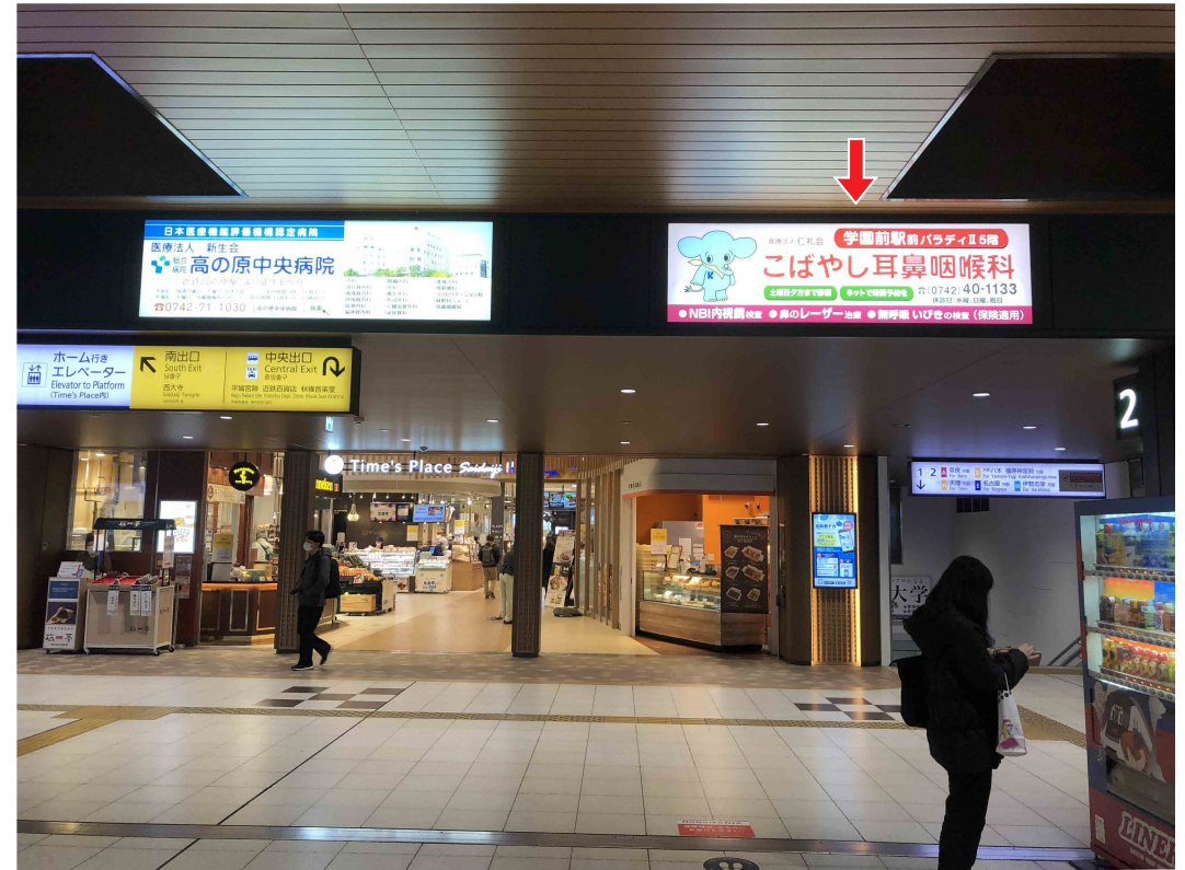
※写真は現状と異なる場合がございます