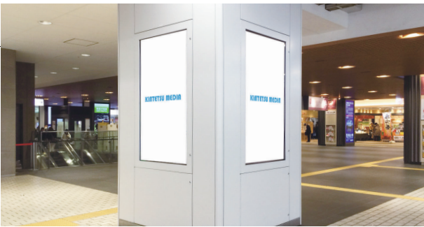
※画像のディスプレイは70インチのものです。

改札内の周辺交通量が多い柱に、3面のデジタルサイネージを設置。時間帯別・曜日別の放映も可能です。